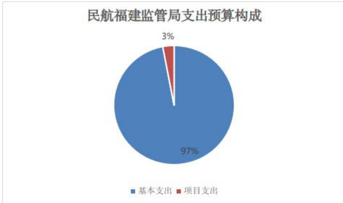
图 2 民航福建监管局2024年支出预算构成

2024年支出预算1,632.81万元，其中：基本支出1,591.81万元，占97.49%；项目支出41.00万元，占2.51%。